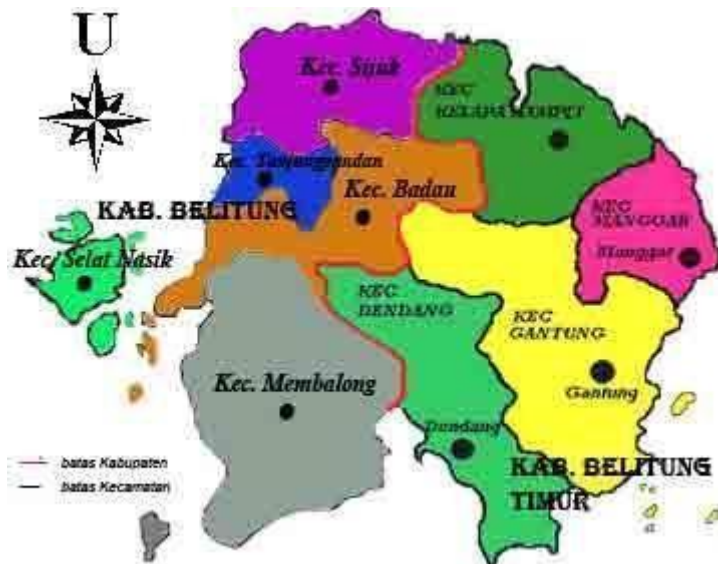
Gambar 1.3. Peta Wilayah Kerja