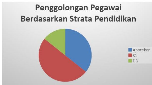
Gambar 1.2 Penggolongan pegawai berdasarkan pendidikan