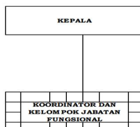
Gambar 1.1 Bagan Struktur Organisasi